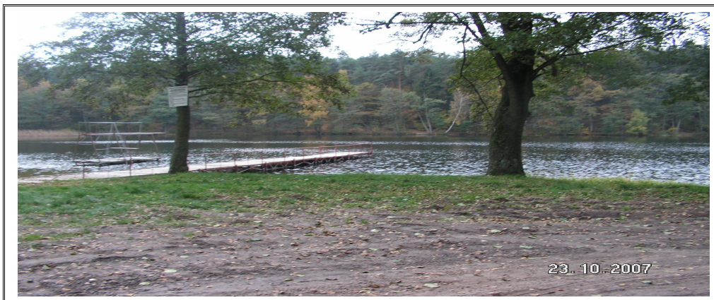
Jezioro Rakowe - Kisielickie