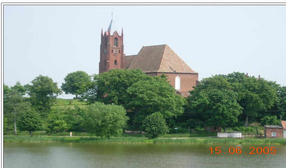
Kościół pod wezwaniem Matki Bożej Królowej Świata w Kisielicach

Mieszkańcy Sobiewoli uczęszczają do kościoła w Kisielicach.