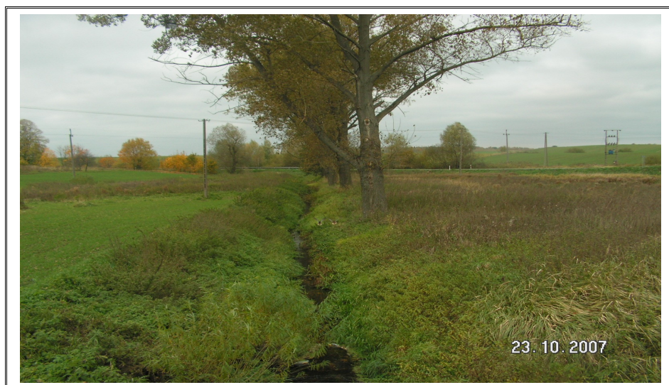
Rzeka Gardęga ( Gardeja)

Sobiewola znajduje się Jezioro Rakowe( - Kisielickie) i rzeka Gardęga.