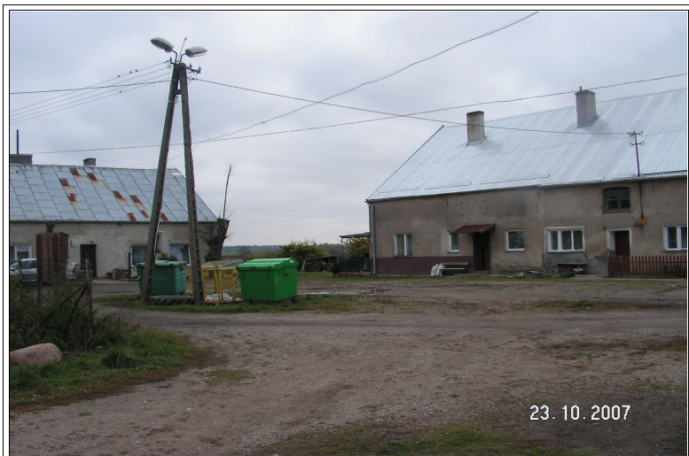
Zabudowa zagrodowa miejscowości Sobiewola