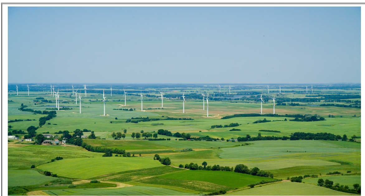
Farma wiatrowa-Gmina Kisielice

Sołectwo obsługiwane jest przez Elbląskie Zakłady Energetyczne S.A. Rejon Energetyczny w Kwidzynie, posterunek energetyczny w Suszu. Wszystkie budynki są wyposażone w energię elektryczną.